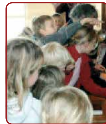
Besøk fra skoler og barnehager